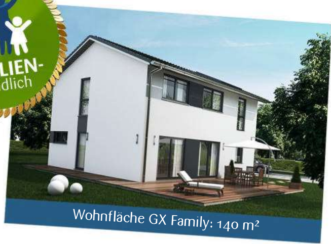
Wohnfläche GX Family: 140 m 2

Gesamtpreis: 367.136 € 345.108 € ab OK Bodenplatte ab OK Bodenplatte *